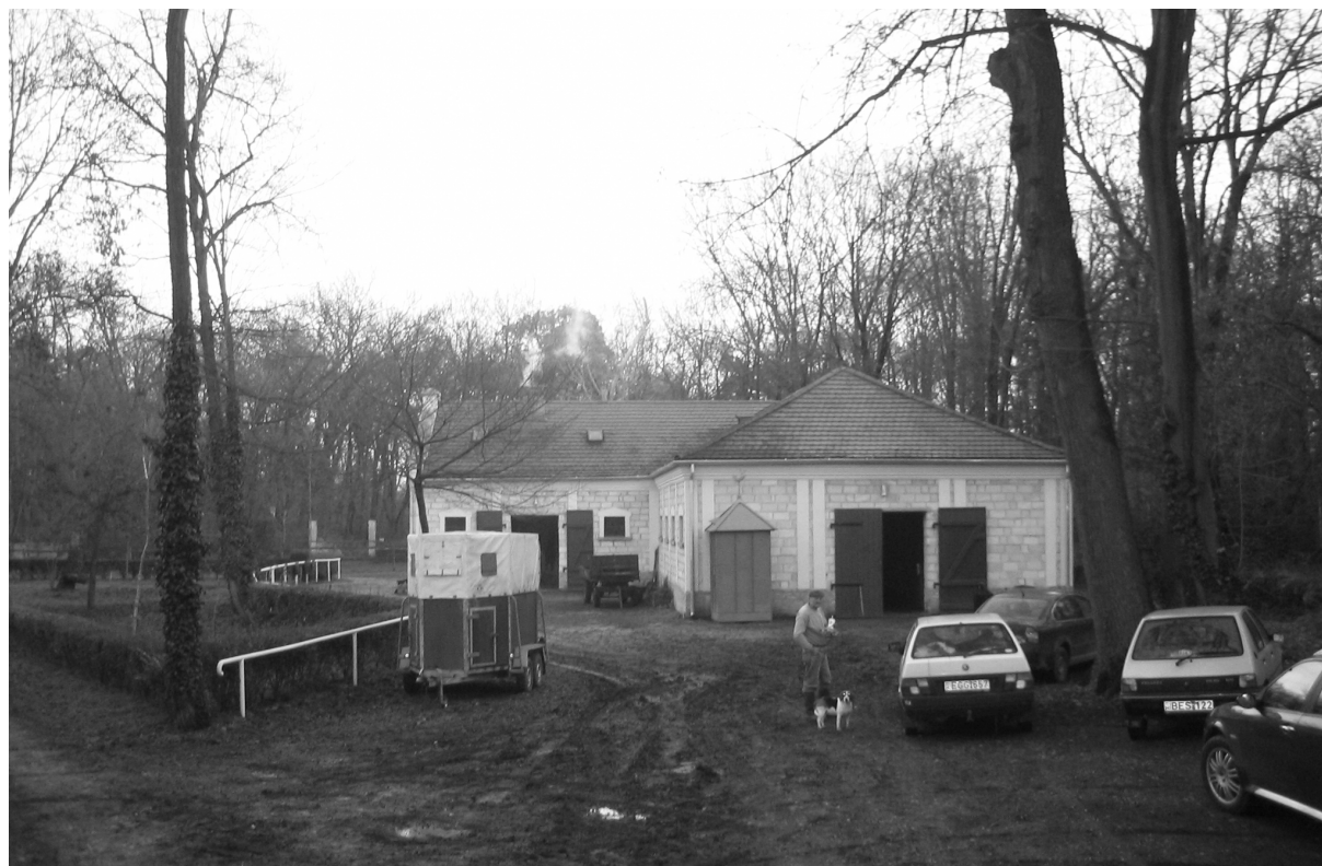
Az istálló megközelítése a jelenlegi bejárat felől