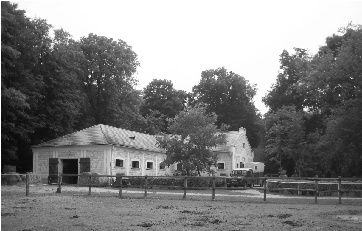
Az istálló északkelet felől, háttérben az arborétum