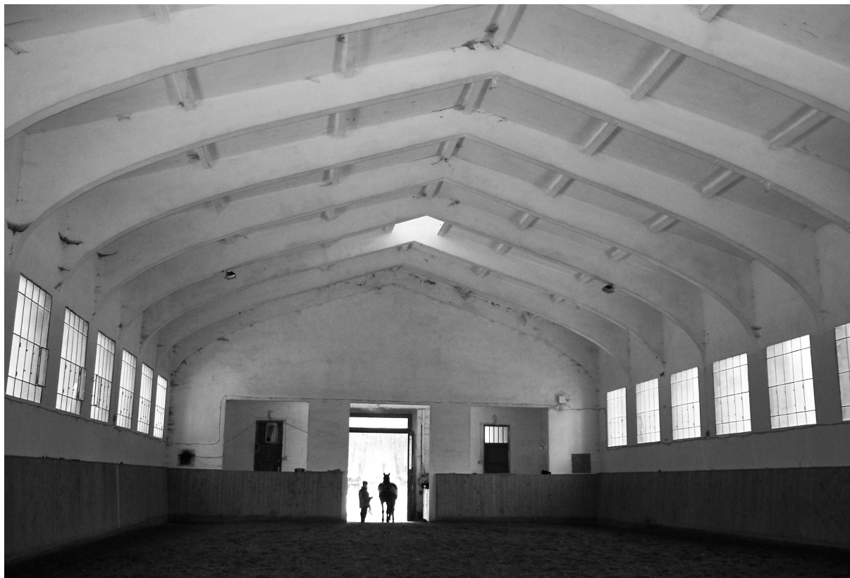
Az Eiffel-iroda által tervezett műemléki lovarda homlokzata és belső látványa