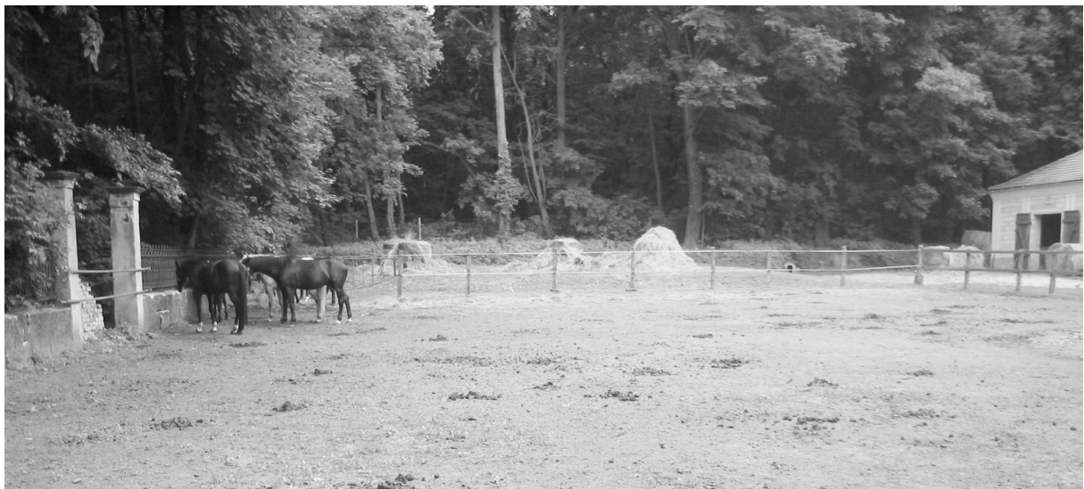
Az arborétum bejárata, a kép jobb oldalán az istállóépület